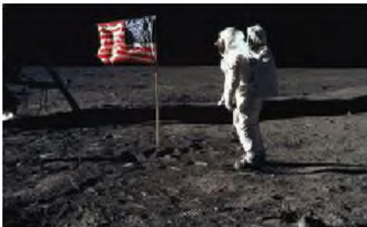
Адамның алғаш рет Айға қонуы

Адамның ғарышты игеруінің келесі кезеңі – ұшырылған ғарыш-кемелер болды. Ғарышкерлер деп ұшқыштар жерге жақын орбитаға ғарышкерлерді жеткізіп, оларды Жерге қайта алып келу үшін жасалған аппараттарды айтады. Ұшу кезінде ғарышкер үшін үйі болатын кемелерде адамның өмір сүруіне қолайлы жағдайлар жасалуы керек. Ғарышкер ұшу үрдісінде кемені өз қалауынша бұруға және орбитаны өзгертуге мүмкіндігі болуы, яғни ұшу кезінде кеме жеңіл қайта бағыт алуы және басқарылуы қажет.