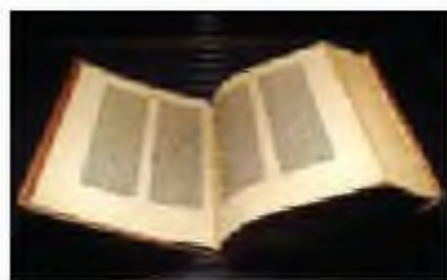
Гутенберттің мұражайдағы Библиясы. Майнц қаласы, Германия

Үлгілер арзан суреттер дайындауда кеңінен қолданылды. Бұл гравюралар алғашында тек суреттерді ғана беріп, кейіннен оларға қоса мәтін берілді. Алдымен тақтайшалардан тек суреттер ғана