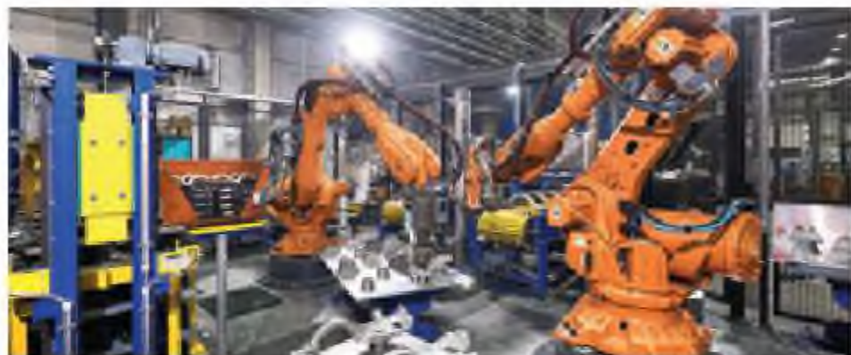
Адам еңбегін автоматтандыру

– олардың жағдайын қашықтықтан бақылау (әсіресе бұл бүкіл организмнің жағдайы мен құрылғының жағдайы туралы ақпарат бере алатын жүрек немесе басқа органдардың импланты болған кезде қолайлы);