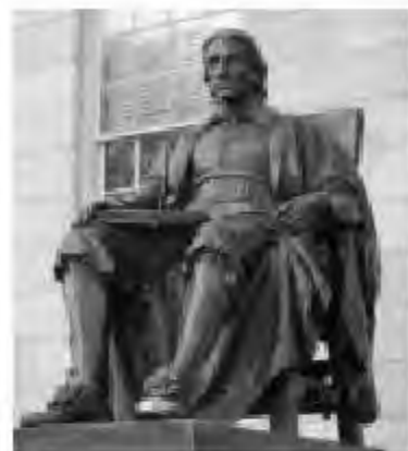
Джон Гарвард ескерткіші

ең көп жеті «еркін өнер» (грамматика, риторика, логика, арифметика, геометрия, музыка және астрономия) факультетінің деканы, құрылған университеттің ректоры болып тағайындалды. Ақсүйектер сотына тәуелсіз және папа билігі жағынан өз құқықтарын бекітіп алған Париж университеті Еуропаның діни ілім орталығы болды. XIII ғасыр ортасында Франция королі IX Людовиктің рухани көсемі Робера де Сорбоннаның бастамасымен университет жанынан тұрмысы нашар студенттерді діни ілімге оқытатын колледж ашылды. XVI ғасырдың ортасында діни ілім колледжі өзінің негізін қалаушының атына ие болып, Париж университетінің жеке факультетіне айналды, ал XVII ғасырда Сорбонна атауы бүкіл университетке қолданыла бастады.