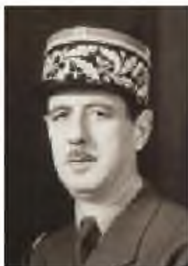
Шарль де Голль (1890–1970)

1958 жылы желтоқсанда Ш.де Голль Франция президенті болып сайланды. Ол мемлекеттің отарлық бағыттағы саясатын толығымен тоқтатты: барлық африкалық отар елдердің тәуелсіздігін мойындады, 1962 жылы Алжирға тәуелсіздік беріп, ушыққан алжир мәселесін біржолата шешті. Ш.де Голль 1962 жылы «Франция ұлылығын» қайта қалыптастыруға қажетті әлеуметтік-экономикалық реформалар өткізуді қолға алады.