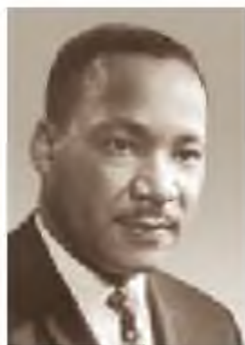
Мартин Лютер Кинг (1929–1968)

аударады. 25 жасында баптистік шіркеудің пасторы болды. Кинг оқуын одан әрі жалғастыруды қалап, Бостон университетіне жүйелі теология бойынша докторантураға түседі де, 1955 жылы философия дәрежесі бойынша диссертация қорғайды. Кинг докторантурада оқып жүріп, баптистік шіркеуде дін қызметшісінің көмекшісі болды.