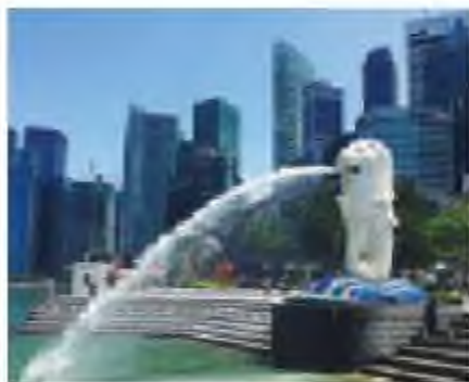
Сингапур символы — мифология кейіпкері Мерлайон (жартылай балық, жартылай арыстан)

Сингапурда өндірілетін көлік, тоңазытқыш, кондиционер, радиоқабылдағыш, теледидар және магнитофон өндірістерін қолдау үшін арнайы шаралар қолға алынды. Бұрын елде мұндай өндірістер мүлдем болмаған еді, бұл «осындай өнімдерді біз де жасай аламыз деген үмітпен жасалды». Жұргонгта арнайы индустриалдық аудан құрылып, оған мол қаржы салынды, бұл өндірісті дамыту мақсатында жасалды. Арнайы аймақта барлық инфрақұрылым толығымен жасалды. Біртіндеп Жұронг ірі корпорациялар шоғырланған орталыққа айналды, әсіресе жоғары технологиялық өнім электроника өндірісі айрықша дамыды. Американың ейгілі үш компаниясы (Тексас инструментс, Нэшнл семикондактор және Хьюлетт Паккард) Джуронгте өз бөлімшелерін ашты, жаңа жұмыс орындары пайда болып, қомақты инвестиция құйылды. Бұл оң өзгерістер Сингапурды электроника мен жоғарғы технологиялық өнімдер өндіретін жетекші аймаққа айналдырды, мемлекеттің болашағына жағымды әсер етті. Мемлекет басты басымдылықты электроника нарығына аударды, өйткені бұл сала сыртқы әсерлер мен шикізат өндірісіне тәуелді емес еді. Электроника саласының өркендеуі елдегі жұмыссыздық мәселесін шешіп, Сингапурды аса ірі экспорт жасаушы елге айналдырды.