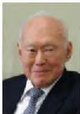
Ли Куан Ю (1923–2015)

1961 жылы Экономикалық даму басқармасы (ЭДБ) құрылады, бұл құрылым кәсіпкерлікті бастау мен оны дамыту бағытындағы мәселелерге жауапты болды. Мұндай жүйенің құрылуы бюрократиялық тосқауылдар мен қаптаған кедергілердің санын қысқартты. Мұндай оңтайлы шешім ірі бизнесті өркендету мен шетелдік инвестицияларды көптеп тарту мақсатына пайдаланылды. ЭДБ атқаратын негізгі қызметтер нақты белгіленді. Өндірістің төрт бағыты: кеме жасау мен құрастыру, көлік шығару, химия өндірісі, электр құрылғылары мен құралдарын өндіру басты назарға алынды өрі оларға басымдылық берілді. 1965 жылдың 9 тамызында Сингапур тәуелсіздікке қол жеткізген