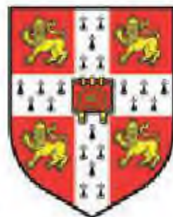
Кембридж университетінің гербі

Алғашқы университеттер феодал ақсүйектер мен қалалық билікпен шиеленісті күрес нәтижесінде, автономиялы және сайлау арқылы өзін-өзі басқаруға құрылған студенттер мен оқытушылар қауымдастығын құрады. Ортағасырлық қаланың цехтық құрылымын ескере отырып, студенттер мен оқытушылар бір ұйымға бірікті. Профессорлар факультет бойынша бірікті. Студенттер жерлестік бойынша бірікті. Студенттік бірлестіктердің өзінің жарғысын шығарып, өз иерархиясы, өзінің салт-дәстүрлері болды.