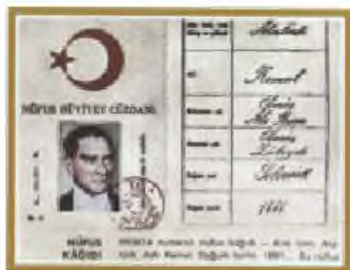
Ататүрік құжаты (1934)

Кемализм принциптері бойынша жарияланғандар: республикашылдық (басқарудың республикалық формасына адалдық), ұлтшылдық (түрік ұлтын асқақтату), этатизм, лаицизм (дінді мемлекеттік істерден және халық ағарту саласынан бөлу), халықшылдық (түрік халқының бірлігі, Түркияда таптық бөлініс пен тап тартысының болуын жоққа шығару), төңкерісшілік (кемализм идеясы мен реформаларына, азаттық үшін күрес принциптеріне адал болу).