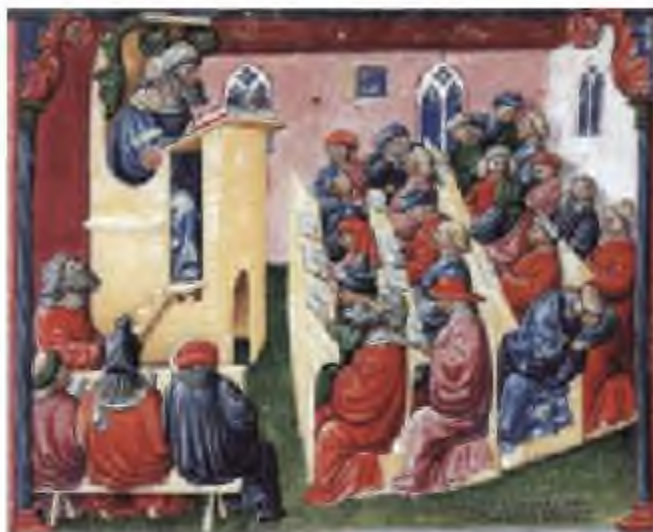
Ортағасырлық университет (миниатюра 1350 жж.)

факультет бірнеше бөлімдерді біріктіреді және келесі салаларда олардың жұмысын үйлестіріп отырады: 1) ғылыми – әртүрлі пәндерді оқу; 2) қандай да бір материалды зерттеушілік-тәжірибелік оқып-үйрену; 3) оқыту – студенттерге, жоғары оқу орнында оқушыларға пәндерді, сабақтарды оқыту (лат. studens – ынтамен жұмыс істеуші, оқушы); 4) тәрбиелік – оқыту арқылы студенттердің бойына әртүрлі қасиеттерді сіңіру.