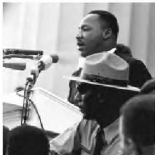
Мартин Лютер Кинг азаматтық шеру кезінде сөйлеген сөзі

1960 жылы «бейбіт күресу науқанының» басталуымен АҚШ-тағы азаматтық құқық үшін күресі жаңа деңгейге көтерілді. Олардың ең басты нысаналары нәсілдік сегрегацияға – яғни мектептерде ақ нәсілділер мен қара нәсілділерді бөлек оқыту, қараларды ақтарға арналған көпшілік орындарға кіргізбеу секілді кемсітушілікке қарсылық болды.