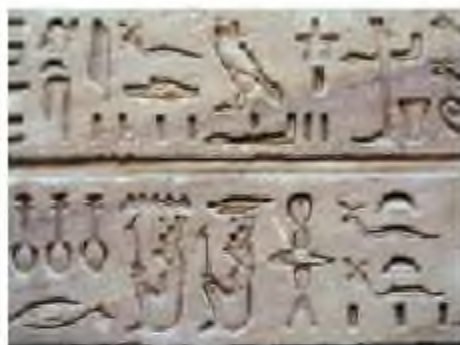
Египеттік иероглиф жазбасы

Сына жазу. б.з.б. IV–I ғасырларда Таяу Шығыс пен Кіші Азия аумағында кең таралған жазба жүйесі. Жазудың бұл түрін қыш тақтайшаларына үшкір қамыс таяқшалардың көмегімен сына түрінде пайда болған. Сына жазуын б.з.б. IV ғасырда Оңтүстік Месопотамияға қоныстанған шумер халықтары ойлап тапқан. Алғашында белгілер нақты бір заттың, жануарлар мен адамдардың бейнесін көрсеткен, бірақ осыған байланысты күрделі