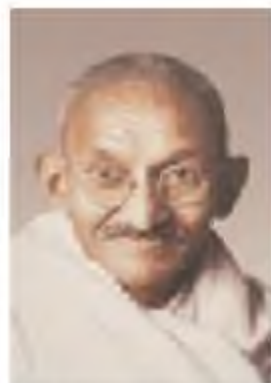
Махатма Ганди (1869–1948)

1920 жылы 1 тамызда азаматтық бойсұнбаушылықтың бірінші жалпыүнділік кампаниясы басталды. Бұл шара шаруалардың қозғалысы мен қақтығыс күрестерінің бейбіт сипаттағы шерулер мен картал түрінде өтуіне негіз болды. Алайда 1922 жылы ақпанда Чаури-Чаура жерінің тұрғындары күш қолдануға қарсылық ұстанымын