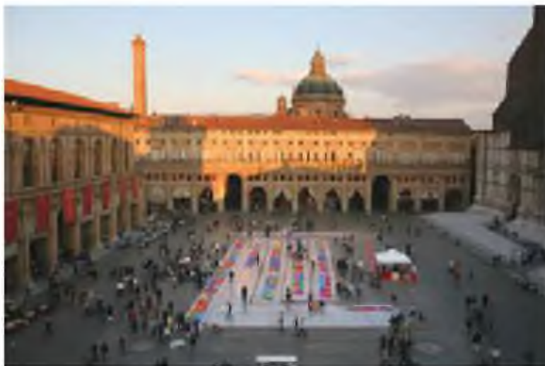
Бүгінгі Болонья университеті

дөңгелек қатарлы орындықтары бар университеттің 13 дәрістік аудиториялары дәлел болады.