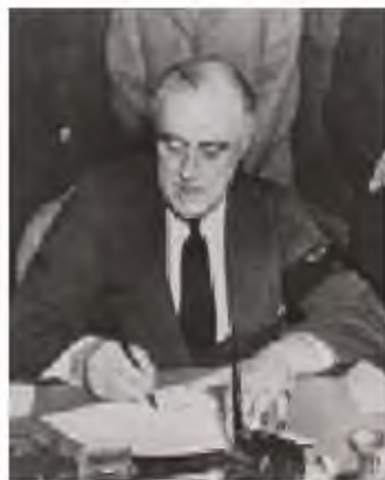
АҚШ Президенті Франклин Рузвельт Перл-Харборға жапондықтар шабуыл жасағаннан кейін Жапонияға соғыс жариялау туралы декларацияға қол қоюда

ғана жүзеге асырмауы тиіс. Ол үшін Еуропа мен Азиядағы державалар өзара үстемдік үшін таласпауы тиіс, бұл сонда ғана жүзеге асуы тиіс, ондай жағдайда кеме жасайтын қуатты өндіріс күштерін екі континентке орналастыруға болатын еді. Сонымен қоса Рузвельт Францияны, Британия империясын, Қытай мен КСРО-ны қолдау қажет, өйткені олар жанама түрде болса да АҚШ-ты қолдайды деп санады.