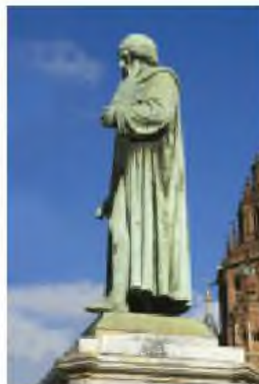
Гутенберг ескерткіші Майнце қаласында

Кітап басып шығарудың Гутенберг ашқан әдісі адамзаттың қажеттіліктеріне қаншалықты жарағанын уақыт көрсетті. Еуропаның өртүрлі қалаларында жүздеген баспаханалар пайда болды. 1500 жылға қарай бүкіл Еуропа бойынша 30 мыңға жуық өртүрлі кітаптар шығарылды. Өз басылымдарын аса тартымды ету үшін шеберлер өз кітаптарын алғашында ақ-қара, кейіннен түрлі түсті суреттермен толықтырып, бірінші бетін әдемілеп безендірді.