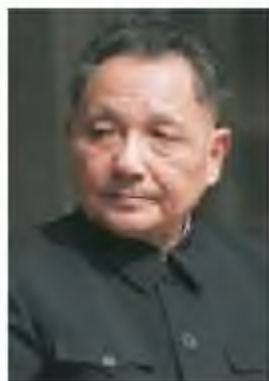
Дэн Сяопин (1904–1997)

ҚХР экономикасында реформалар жүргізу туралы ресми шешім Дэн Сяопиннің бастамасымен 1978 жылы желтоқсанда ҚКП ОК пленумында қабылданды. Пленум елдегі барлық экономикалық жүйені жаңғыртудың стратегиялық бағытын қабылдады. Қайта құрулар мәнi