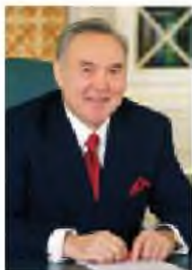
Қазақстан Республикасының Тұңғыш Президенті Н.Ә.Назарбаев

алды. Референдумдарды енгізуге кедергі болған, Жоғарғы кеңес таратылған соң, ол өз жарлығымен қажетті заңдарды іске асырды. Дәл сол кезеңдерде Мемлекет басшысының күшті саяси ерік-жігері мен табандылығы қалыптасты.