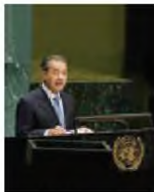
М. Мохаммад Малайзияның жетінші премьер-министрі

1981 жылы М.Мохаммад басқарған үкімет 1985 жылдан бастап федералдық деңгейдегі 10 млн ринггит (курс бойынша 1 долл – 3,8 ринггит болады) төленген жарғылық капиталымен 392 мемлекеттік корпорациялар құрды. 1990 жылға қарай мұндай компаниялар саны 462-ге, ал олардың төленген қаржылары – 18,9 млн ринггитке жетті. Штаттар деңгейінде 1985 жылға қарай жалпы жарғылық капиталы 1,3 млн ринггит болған 206 мемлекеттік корпорациялар құрылды. 1990 жылға қарай олардың саны 258-ге, ал жарғылық капиталы 2,1 млн ринггитке жетті.