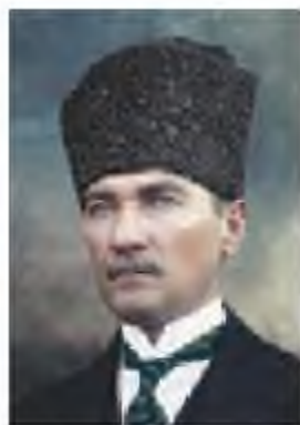
Мұстафа Кемал Ататүрік (1881–1938)

Академияны аяқтайтын уақытта Кемалға, сұлтанға қарсы деген айып тағылып, тұтқынға алады да, Сирияның Дамаск қаласына жер аударады. Бұл жерде ол «Ватан» атты партия құрады, түрік тілінен аударғанда бұл «Отан» деген мағынаны білдірді. 1908–1909 жылдары М. Кемал II Абдул-Хамид сұлтанның шексіз билігін құлатқан, жас түріктердің төңкерісіне қатысады. Алайда жас түріктердің билік басына келуі, мемлекеттегі жағдайды түбегейлі өзгерте қойған жоқ, қажетті реформалар жүргізілмеді, осыған орай халық арасында наразылық белең алды. Жас түріктерден көңілі қалған М. Кемал әскери салаға ерекше көңіл бөле бастады.