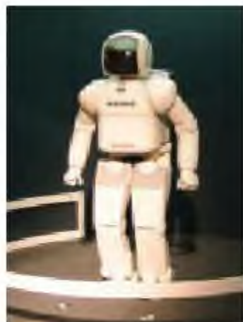
HONDA шығарған ASIMO қадам жасаушы роботы

FEDOR робот-андроид (ағылшынша. Final Experimental Demonstration Object Research – орыс тілінде Зерттеудің финалдық эксперименталдық демонстрациялық нысаны.) – халықаралық ғарыш стансысына «Союз МС-14» өуе кемесімен сапар жасады. Ол басқарушы үшқыштың қызметін атқарды. 2019 жылдың 7 қыркүйегінде ұшырылған ғарыш кемесі аппараты FEDOR Жерге аман-есен қонды.