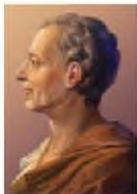
Ш. Л. Монтескье

Ж.Ж. Руссо адамгершілік қоғамдық және мемлекеттік өмірмен тікелей байланысты деп санады. Ол жекеменшікке және одан туындайтын қоғамдық теңсіздіктерге қарсы болды. Руссо қоғамның игілігі жекетұлғалардың мүддесінен артық екендігін айтты және көтеріліс пен қатыгез билеушілердің көзін жою керек деп есептеді.