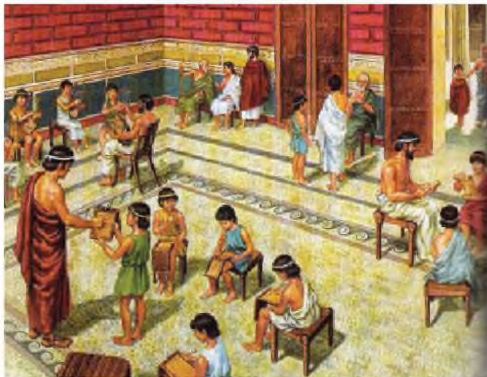
Ежелгі грек гимназиясы

Гимназия (ежелгі грек – жалаңаштанған, жаттығу, іс жүзінде оқу) – грек қалалары мен эллиндік Шығыста б.з.б. IV–V ғасырларда кеңінен таралған 16–18 жастағы жасөспірімдерге арналған мемлекеттік оқу-тәрбиелік мекеме. Гимназияға палестраны бітірген атақты, бай бозбалалар түскен. Гимнастикамен айналысуды жалғастыра отырып, олар философтардың жетекшілігімен әдебиет, философия, саясатты оқыған.