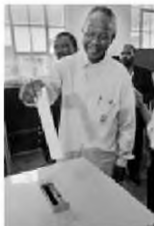
1994 ж. сайлауда Мандела дауыс беруде

құрылуы.., апартеид режімі тарапынан болатын зорлыққа қарсы қорғаныс қадамы болатын. Қарулы күрес қажеттілігін тудырған факторлар өлі де өмір сүруде. Бізде бастаған істі жалғастырудан басқа таңдау жоқ. Біз жақын аралықта келісімдер аясында мәселелерді реттеуге қолайлы жақсы жағдай орнайды, қарулы күрес қажеттілігі болмайды деп үміттенеміз». Мандела өзінің басты мақсаты, елдегі халықтың басым бөлігі болып табылатын қара түстілер үшін бейбітшілікке қол жеткізу және оларға жалпыұлттық та жергілікті сайлауларда дауыс беру құқығына қол жеткізу екенін атап өтті.