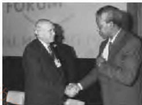
Манделамен Фредерик де Клерк, 1992 ж.

Бостандыққа шыққан күні Мандела халық алдында сөз сөйледі. Ол келіспеушілікті бейбіт түрде елдегі ақ түсті тұрғындармен келісе отырып реттеуге ынталы екенін білдірді, алайда АҰК қарулы күресі өз мүддесіне толық жетпегенін де айтып, былай мәлімдеді: «Біздің 1960 жылғы қарулы күрес туралы үндеуіміз. АҰК қарулы қанатының