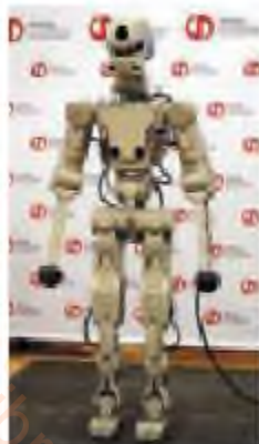
Ресейлік FEDOR робот андронды

Ғарышкерлік тарихы бірнеше онжылдықтарды ғана қамтиды, бірақ осы уақыт ішінде ол бірқатар маңызды кезеңнен өтті. 1957 жылы 4 қазанда Кеңес Одағы әлемде бірінші болып Жердің жасанды серігін ұшырды. Бұл күн Жер тарихындағы жаңа ғарыштық кезеңнің басын ашты. Жер серігі барлық кейінгі ғарыштық техника өсіп шыққан тұқым болды. 1957 жылы 3 қарашада ғарышта өзінің жұмысын аяқтағанға дейін 1958 жылы 14 сәуірде жерді 2370 рет айналған екінші кеңестік жер серігі ұшырылды. Онда ғылыми аппарат орнатылып, Лайка атты итке арналған орын болды. 1958 жылы 31 қаңтарда ғарышқа үшінші Жер серігі – орбитада 8 апта жұмыс істеген америкалық «Экспорер – 1» ұшырылды.