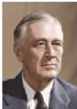
Франклин Рузвельт (1882–1945)

«Жаңа бағыт», мемлекеттік жүйе, оқшаулану саясаты, карантин