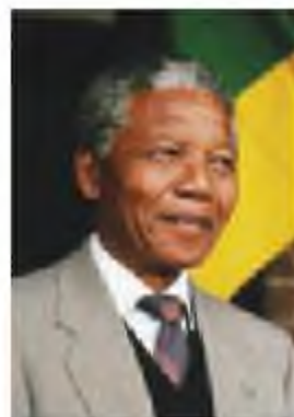
Нельсон Мандела (1918–2013)

1962 жылдың тамыз айында Мандела тұтқынға алынады. Сотта оған 1961 жылғы жұмысшылар ереуілін ұйымдастырды және мемлекеттік шегараны заңсыз бұзды деген айып тағылады. 1962 жылы қазан айында оны 5 жыл мерзімге соттап, түрмеге қамайды.