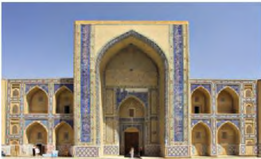
Бұхарадағы Ұлықбек медресесі

Мектеп ( араб. мактаб – «жазу орны») – Арабияда VII–VIII ғасырларда пайда болған бастауыш діни мектеп. Мұсылмандық миссионерліктің дамуымен және исламның нығаюымен Таяу және Орта Шығыс елдеріне таралды. IX–X ғасырларда мектеп Орта Азия, Өзiрбайжан, Волга бойы және Сiбiрде пайда болды. Мектеп әдетiнше мешiттер жанында орналасты. Онда, негiзiнен, 7–13 жасар ер балалар оқыды; оқу мерзiмi 7 жылға созылды. Кейiнiрек, бiрқатар мұсылман елдерiнде әйелдер мектебi құрылды. Мұғалiм рөлiн молда атқарды.