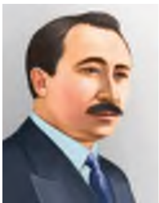
Сәкен Сейфуллин (1894–1938)