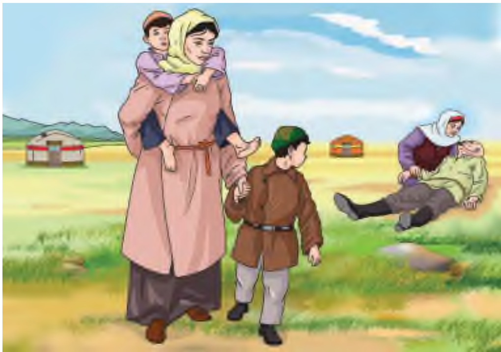
«Ұлы жұт» қасіреті