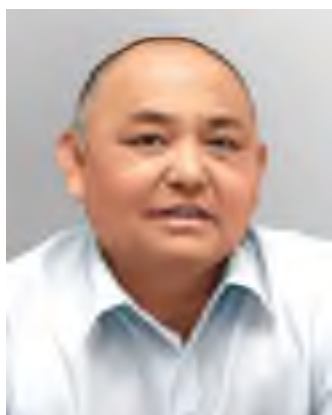
Таласбек Әсемқұлов (1955–2014)