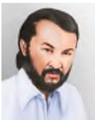
Асқар Сүлейменов (1938–1992)

Асқар Сүлейменов қай өңірде туып-өсіп, білім алған?