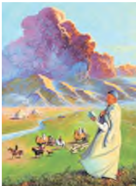
Қалың елім, қазағым, қайран жұрттым

Эпилогта Татьянаның әні жұрт арасында кеңінен тарайды. «Алда – өмір, тартыс. Сол тартыста бұл жалғыз... бір қуаты, бір үміті бар... Қуаты – ақындық, үміті – халық».