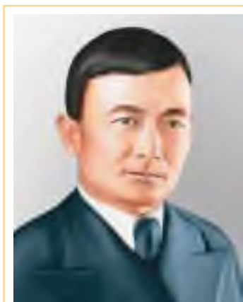
Қасым Аманжолов (1911–1955)

Қасым Аманжолов қай өңірде туып-өсіп, білім алған?