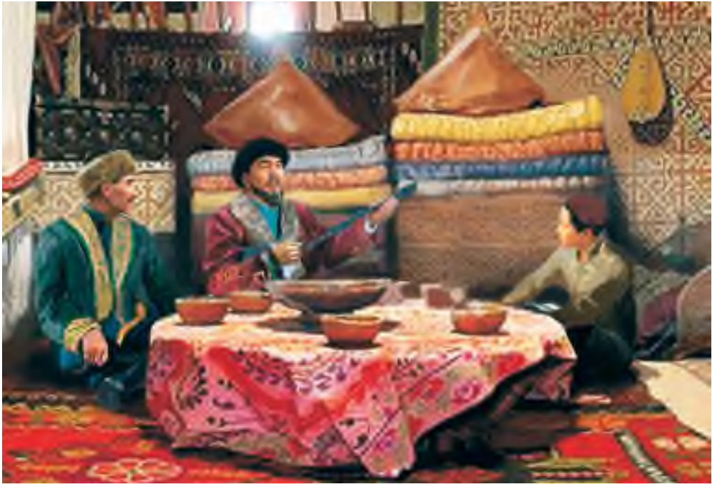
Бала Абай ақындармен бірге

Ұшады бозша торғай көдені ықтап, Басасың аяғыңды нықтап-нықтап. Кәрі әжем естімейді, нана берсін, Берейін өлеңіммен шын ұшықтап, –