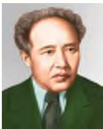
Мұхтар Әуезов (1897–1961)

Жазушы қай өңірде туып-өскен? Қандай отбасынан шыққан?