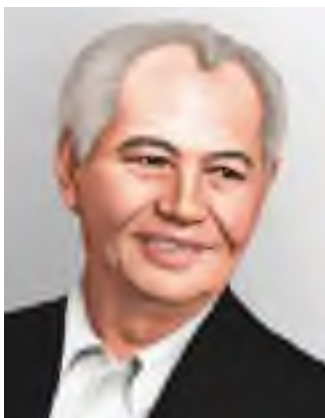
Ілияс Есенберлин (1915–1983)