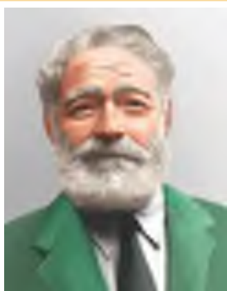
Эрнест Миллер Хемингуэй (1899–1961)

Эрнест Миллер Хемингуэй (Ernest Miller Hemingway) 1899 жылы 21 шілде күні АҚШ-тың Иллинойс штаты Чикаго маңындағы Оук-Парк қалашығында дүниеге келген.