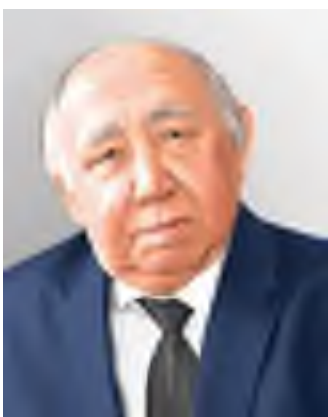
Тұманбай Молдағалиев (1935–2011)