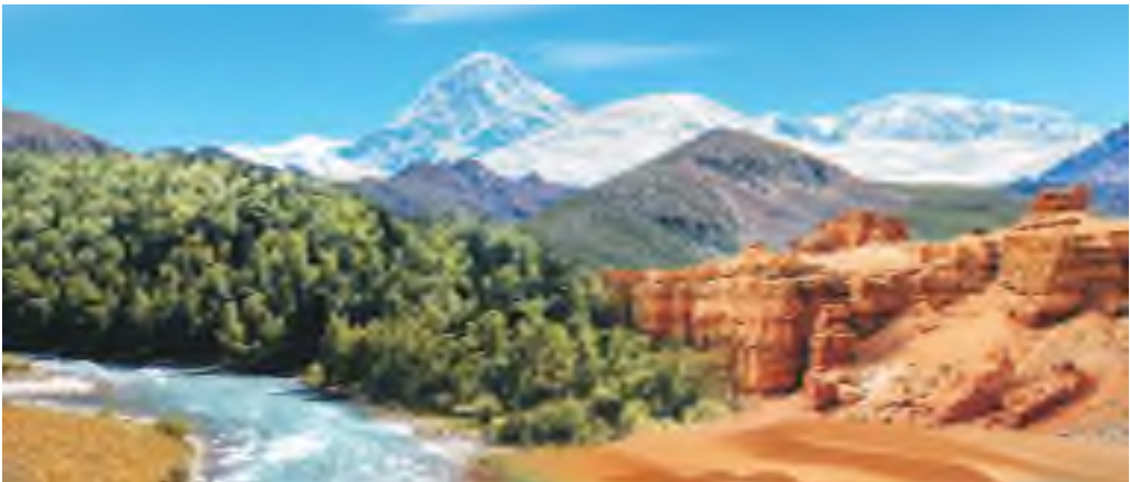
Табиғаты тамылжыған Қазақстан

Менің тауым мына тау – сенің тауың, Ақбас шыңын алты ай жаз жуған жауын. Жалғыз рет көрсең де тірлігіңде, Мүмкін емес сол тауды сағынбауың, –