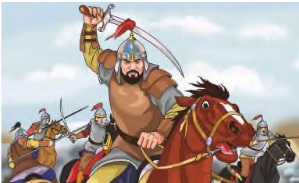
Қаһарлы Кенесары хан

«Қаһар» романында XIX ғасырдың I жартысындағы Кенесары Қасымұлы бастаған халық көтерілісі сөз болады. Патша отаршылдарының шектен шыққан қысымы, әсіресе, ата-бабасынан мирас боп келе жатқан туған жерінен зорлықпен ығыстырылуы халықтың қанын қайнатып, ашу-ызасын туғызды. Бұл наразылықтың көтеріліске ұласуына Абылай ханның немересі Кенесары тікелей басшылық етеді. Шығармада Кенесарының жеке басы ерлік пен мәрттікке толы. Романда кездесетін орыс сөздері қазақтың өз тіліне бейімдеп айтылуы бойынша берілген. Мысалы, устав – ұстап. Бұл сөз патшаның 1822 жылғы Сібір қазақтарын басқару жөніндегі уставына байланысты қолданылған. Жазушы архивтік құжаттар мен Кенесарының орыс билеушілеріне жазған хаттарына сүйене отырып, шығарма мазмұнын нақты деректерге құра білген.