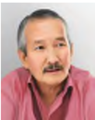
Смағұл Елубай 1947 жылы туған