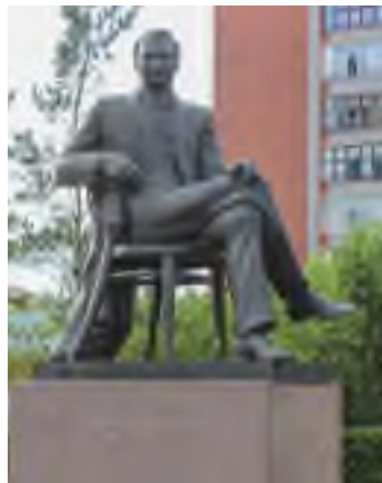
Нұр-Сұлтан қаласындағы С.Сейфуллин ескерткіші

қиянаты жоқ. Адалдық пен арамдық, мансап пен ар-ұждан, достық пен қастықтың аражігін аша жазып, адам үшін құнды байлық – достықты жырлайды. Дос көңілін тау шыңындағы алтын сарайға, ондағы баға жетпес қоймаға балайды. Ал таудың құзар басына шығу оңай ма екен? Десе де, адам баласының қолынан келмейтіні жоқ, тау шыңына да шығуға болады. Бірақ тау шыңына шыққанмен, ол жерде кез келгеннің қолы жете бермес алтын қойма бар. Ал тілін, құпиясын таппаған адамға алтын қойма ашыла қоймайды. Сонда қойманы қандай адам ашуға тиіс? Мәселе осында. Өйткені ақынның айтуынша: «Сол қоймада қымбат жасау, Қымбат жасау сақталған», – дейді. Ал енді өресі жеткен адам сол қойманы ашты делік. Міне, сол кезде адам қолына «беті өрнектелген бір сандық» ілінеді. Бірақ «ол сандықта бір сандық» тағы бар болғандықтан, оқиға түйіні «Сырдың кілті қолсандықта» екені және соны тапқан адамда болып отыр. Қолсандық ашылған кезде «Сандық іші қызыл-жасыл, Жасыл жібек перделі. Толған қымбат сақтаулы асыл» екенін көреміз. Оның ішінде тағы «Асыл сым бар пернелі» дейді ақын.